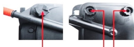
Valvola spurgo acqua/aria Bleed valve water/air